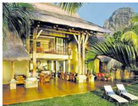
© TUI Traumhotel: Hier macht Jogi Löw Urlaub.

Millionen Zuschauer haben den zauberhaften Spot mit Herrn Löw und seinem kleinen blonden Gegenspieler in den letzten Tagen im Fernsehen gesehen. Und jeder wäre dabei gerne sofort in die Rolle von Vincent geschlüpft, um so Urlaub zu machen wie unser Bundeinstrainer. Genau an diese Traumstrand, genau in dieser wunderbaren Hotelanlage, genau da, wo alles so entspannt und so paradiesisch lässig ist.