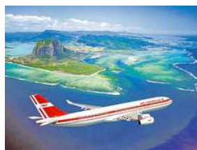
Air Mauritius fliegt nonstop von München nach Mauritius.

Exklusiv bei Air Mauritius ist das kostenlose Terminal-Parken am Flughafen München bis zu 21 Tagen. Infos: www.airmauritius.de. Flugtickets buchbar unter der Reservierungs-Hotline 069/ 24001999, unter www.airmauritius.de oder im Reisebüro.